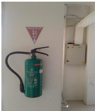
ALAT PEMADAM RINGAN

Untuk pengoperasian APAR, semua Satpam sudah diberikan pelatihan penanganan kebakaran di dalam menggunakan alat ini.